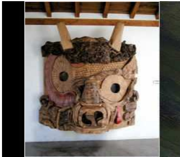
SANTXOTENA PARKE-MUSEOA / PARQUE-MUSEO SANTXOTENA